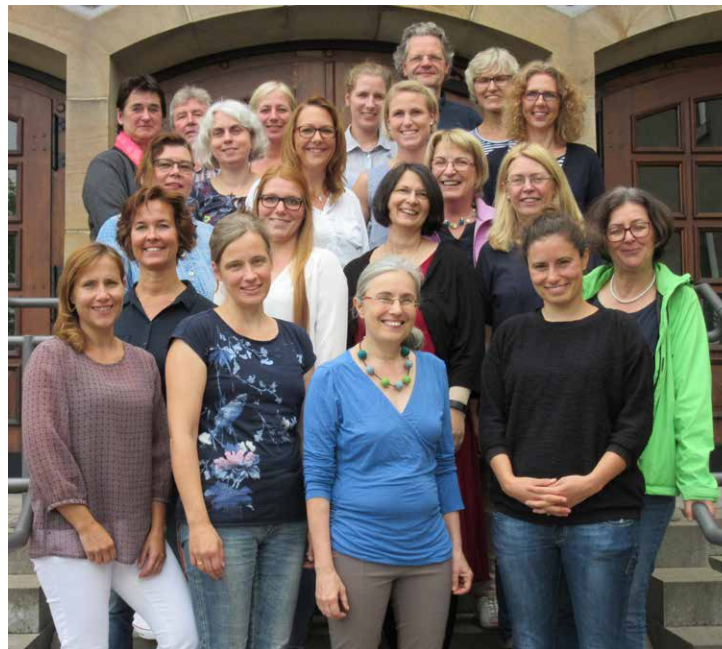
Lehrerkollegium im Schuljahr 2017/2018

Einzelne Schüler und Schülerinnen mit besonderem Unterstützungsbedarf (z. B. autistische Störungen) werden zusätzlich durch Schulbegleiter/innen unterstützt.